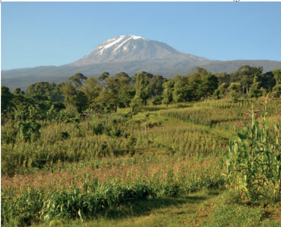
Foto boven: In het gebied rond de Kilimanjaro is een overvloed aan fruitbomen, maïsvelden en koffieplantages

Foto midden: Econome en ontwikkelingsconsultant Janet Mbene in een restaurant in Dar es Salaam